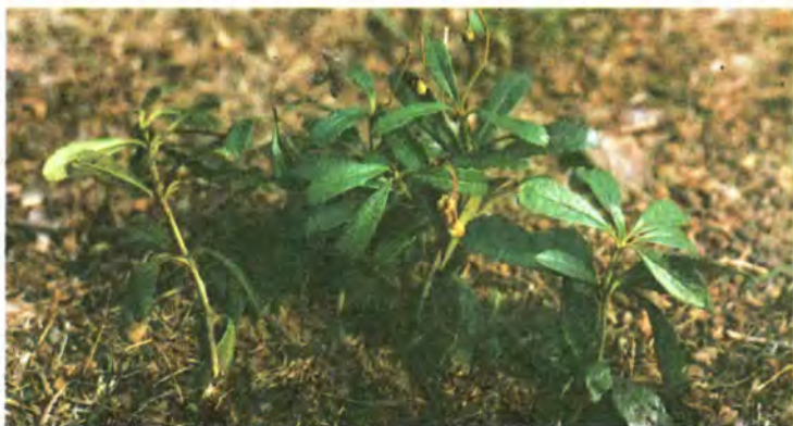
296. Зимолубка зонтична.